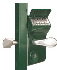
Serrure à code mécanique