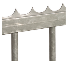
Lisse défensive à souder ou à visser