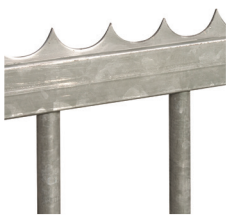
Lisse défensive rivetée sur le portail