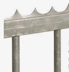
Lisse défensive rivetée sur le portillon