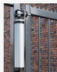
Ferme porte Rhino