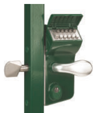
Serrure à code mécanique